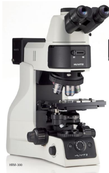
Microscopio metallografico con PC e software installato per l'analisi della struttura