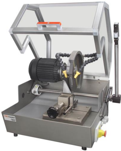
Troncattrice manuale per il taglio dei particolari da verificare

Abbiamo disponibili usati ma in ottimo stato diversi strumenti da laboratorio per reparti di trattamenti termici (gli strumenti sono visionabili presso il ns stabilimento):