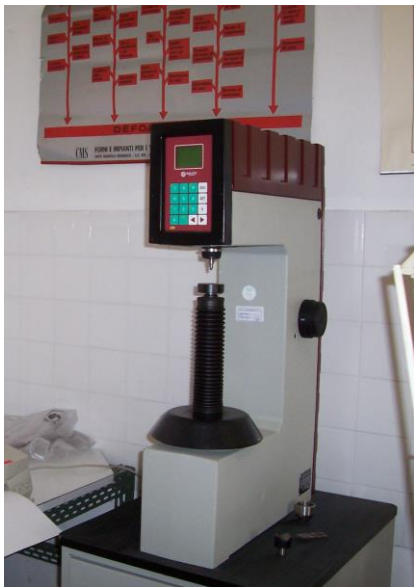
Durometro digitale Rockwell e Brinell