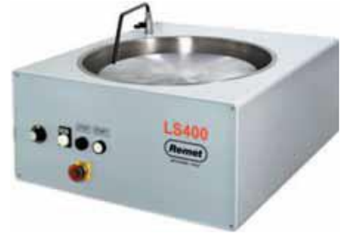
Smerigliatrice pulitrice per la preparazione dei campioni metallografici per la successiva prova di durezza o analisi metallografica