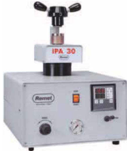
Pressa inglobatrice per inglobare i particolari tagliati con particolari resine e renderli atti alla prova di durezza o all'analisi metallografica